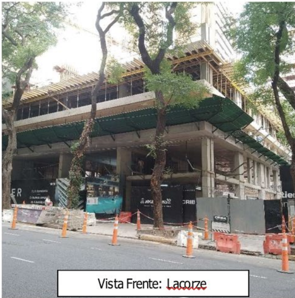
Vista Frente: Lacroze