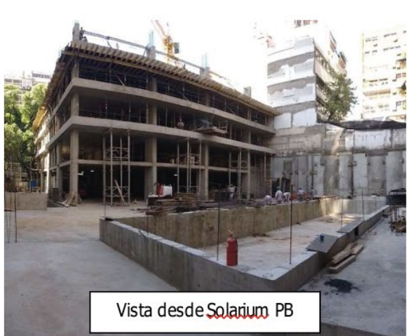
Vista desde Solarium PB