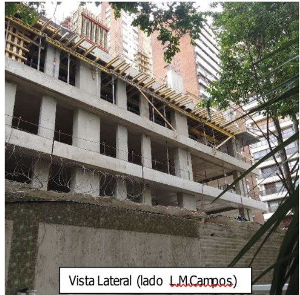
Vista Lateral (lado L.M. Campos )