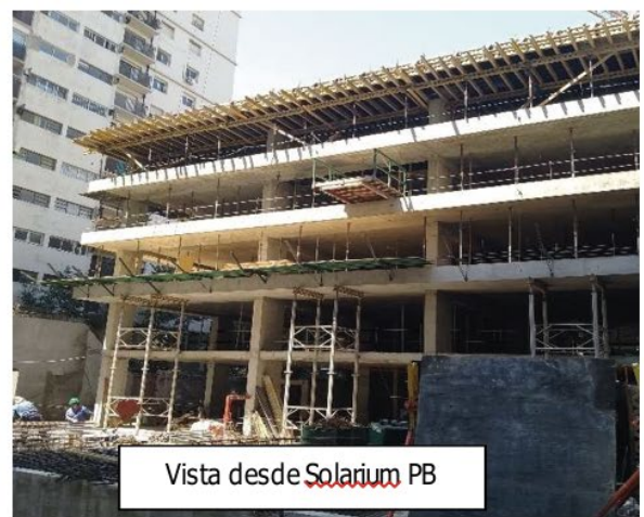
Vista desde Solarium PB