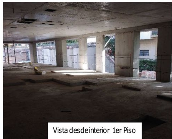
Vista desde interior 1er Piso