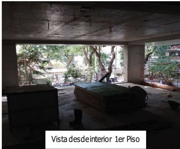
Vista desde interior 1er Piso